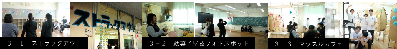
3-1 ストラックアウト