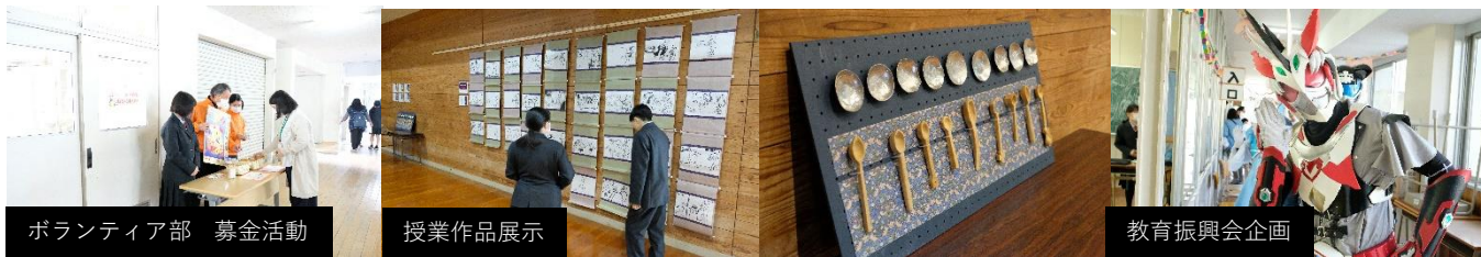
ボランティア部 募金活動