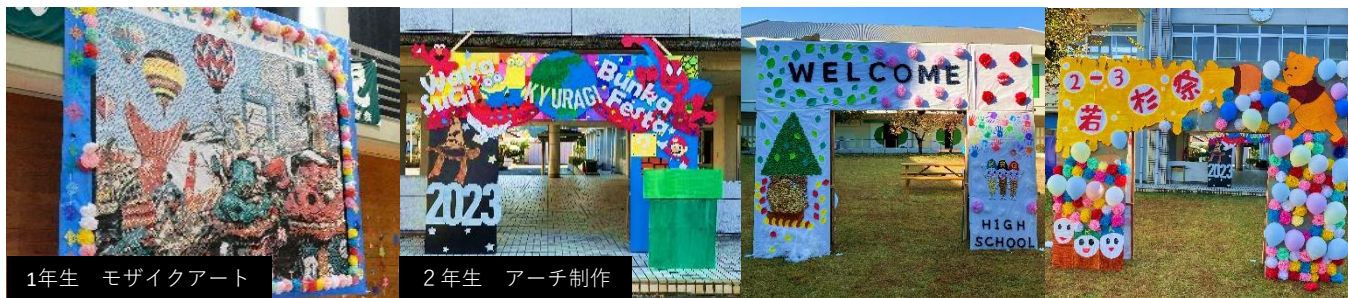
1年生 モザイクアート

3年生は各教室で趣向を凝らした企画、2年生は中庭でアーチを展示、1年生は体育館でモザイクアートを展示し、文化祭を盛り上げてくれました。授業の成果発表や文化部の展示・販売では日頃の努力の成果を発揮しました。また、本年度は教育振興会の企画としてヒーローショーも開催され、文化フェスタに華を添えていただきました。